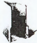
فولدر ۴ مدارک و مستندات حسن سابقه