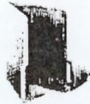
فولدر ۵ مدارک و مستندات توان مالی