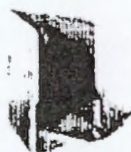
فولدر ۱ اسکن برگه‌های استعلام ارزیابی کیفی