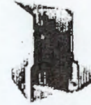
فولدر ۷ مدارک و مستندات توان فنی برنامه ریزی