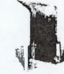
فولدر ۱۱ مدارک و مستندات توان مدیریتی