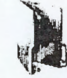
فولدر ۱۰ مدارک و مستندات دانش فنی در زمینه مطالعه و طراحی