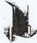
فولدر ۶ مدارک و مستندات توان تجهیزاتی