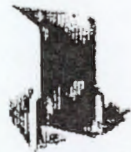
فولدر ۳ مدارک و مستندات سوابق اجرایی