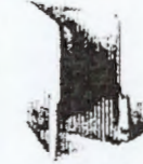
فولدر ۸ مدارک و مستندات HSE