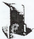
فولدر ۲ مدارک عمومی شرکت