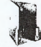
فولدر ۹ مدارک و مستندات تجربه در زمینه تأمین کالا